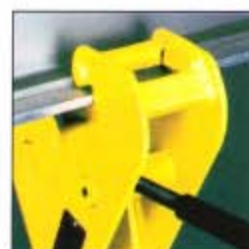
Disegno speciale, a richiesta, per modelli YC 2 e YC 3