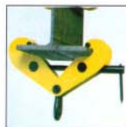
Occhio di sospensione a richiesta