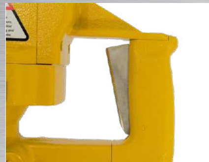
Impugnatura chiusa, con valvola di comando